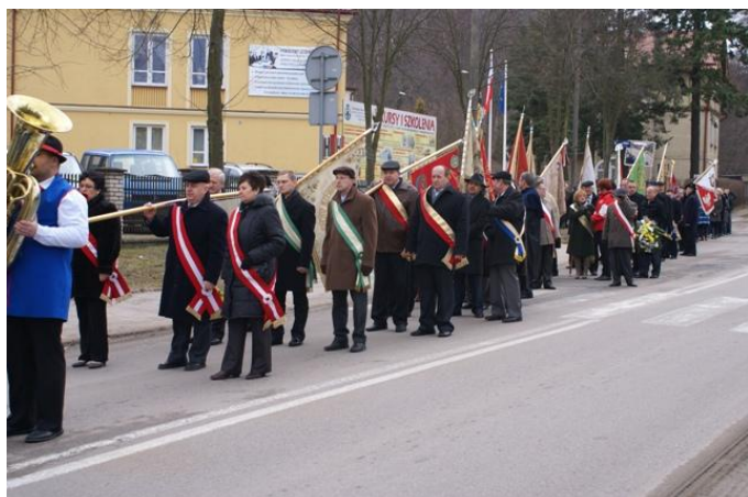
Przemarsz pocztów sztandarowych sprzed Domu Rzemiosła w Wejherowie