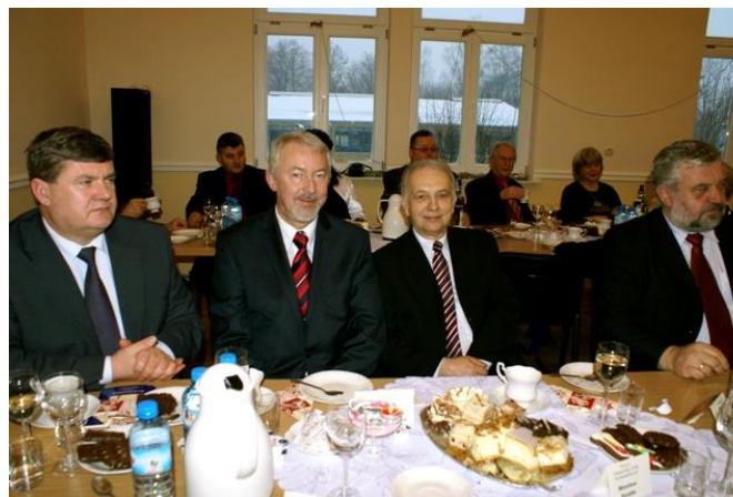
Zaproszeni goście podczas spotkania