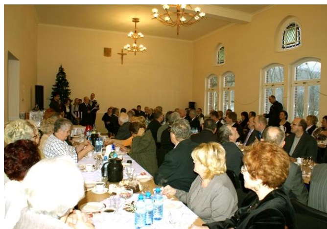
Seniorzy oraz aktywni rzemieślniczy podczas kolędy