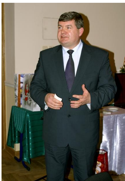
Przemówienie Ministra Rolnictwa – Kazimierza Plocke