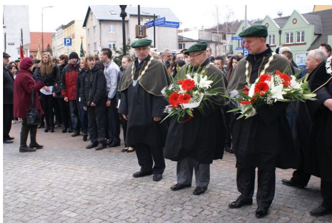
Składanie kwiatów przed obeliskiem na skwerze Jana Pawła II przy Kolegiacie Wejherowskiej