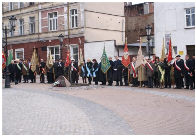
Poczty sztandarowe na Placu Jana Pawła II przy Kolegiacie Wejherowskiej