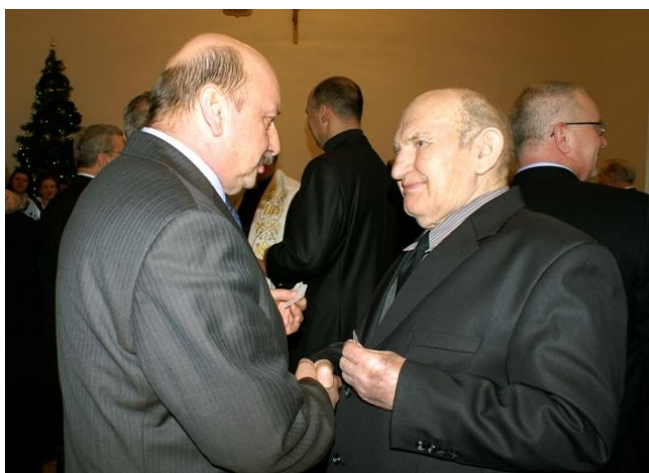
Zaproszeni goście podczas składania sobie życzeń i dzielenia się opłatkiem